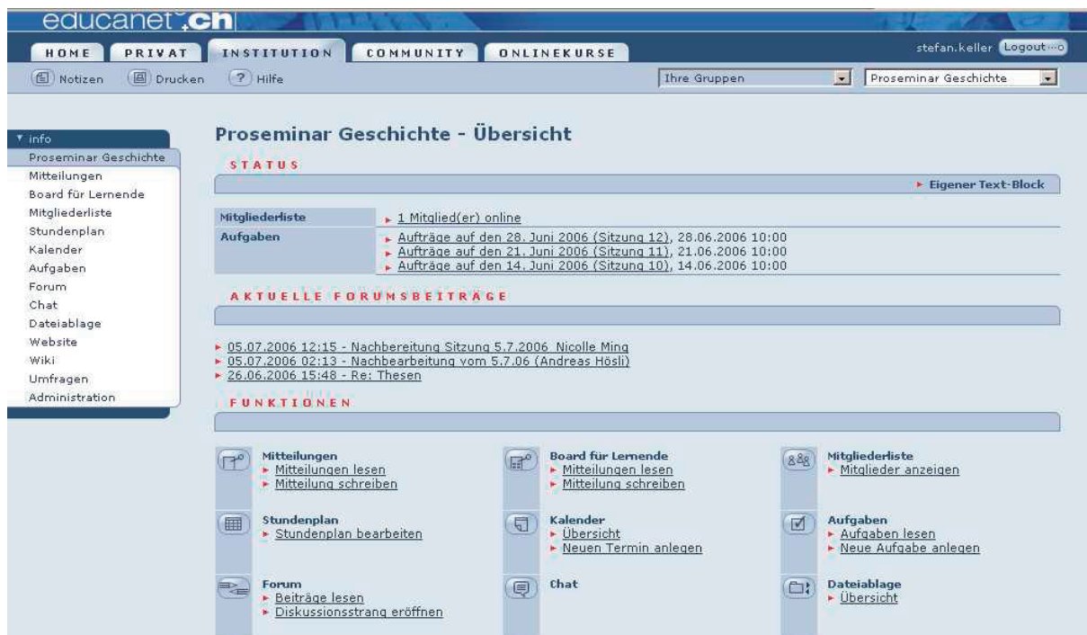
Abb. 2: Educanet: Kursoberfläche «Proseminar Geschichte»

Um einen eine Lehr-Veranstaltung begleitenden, zeit- und standortunabhängigen Kommunikations- und Interaktionsraum zu schaffen und damit experimentieren zu können, wurde versuchsweise im Sommersemester 2006 in einem Proseminar mit 15 Studierenden die Groupware «Educanet» (www.educanet2.ch) eingesetzt. Die Wahl fiel deshalb auf Educanet, weil diese für die Gymnasialstufe entwickelte Plattform 6 für Studienanfänger besser geeignet schien als das für fortgeschrittene Forschergruppen entwickelte BSCW, welches im akademischen Feld sehr verbreitet ist. 7 Bei Educanet handelt es sich um eine sehr übersichtliche «Nachbildung» eines Klassenzimmers mit Stundenplan (Kalender), Aufgabenlisten sowie verschiedener interaktiven Instrumenten wie ein Forum, eine Dateiablage, ein Chat sowie ein Wiki (vgl. Abb. 2).