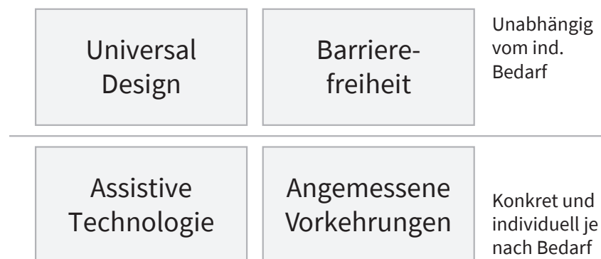
Abb. 1.: Continuum of Solution (eigene Darstellung, nach Bühler 2016).

In den letzten Jahren hat sich das Hochschulwesen als Teil des Bildungssystems stark verändert. Spätestens seit der Ratifizierung der UN-Konvention über die Rechte von Menschen mit Behinderungen (UN-BRK) sind Hochschulen verpflichtet, die gleichberechtigte Teilhabe von Studierenden mit Behinderungen sicherzustellen (United Nations 2017).