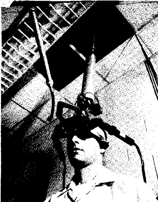
FIGURE 4—The ultrasonic head position sensor in use

Als Zäsur in der technologischen Entwicklung sowohl von Virtual als auch Augmented Reality gilt jedoch Ivan Sutherlands Sword of Damocles von 1968. Die Assoziation mit dem Damoklesschwert wurde durch die bedrohlich über dem Kopf der Rezipierenden angebrachte brillenartige Konstruktion hervorgerufen (Abb. 1).