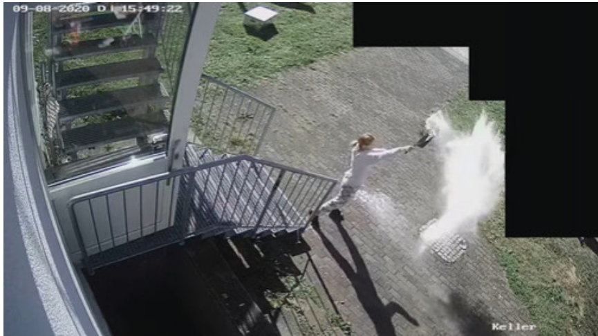
Abb. 1: Screenshot des Videos https://schotten2020.de/video/fajuso/FaJuSo_Ausgang.mp4 ; 00:23 von 02:03 Min. am 21.01.2022.

Ein sonniger Tag im September 2020 in Schotten, einer Kleinstadt in Hessen. Eine Überwachungskamera filmt die Ecke eines Hauses. Um 15:49 Uhr zeichnet sie eine junge Frau auf, die aus dem Haus kommt und ein Kehrblech in der Hand hält. Sie bleibt stehen und lässt ihren Arm nach oben schnellen. Der Inhalt des Kehrblechs rieselt als grosse weisse Wolke auf den Boden (vgl. Abb. 1).